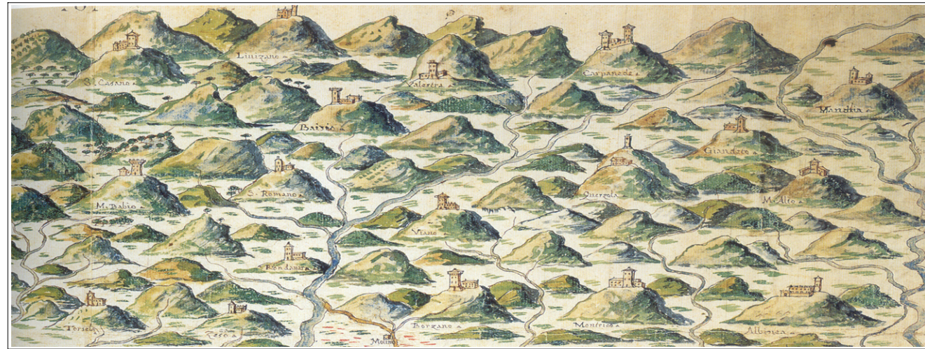
Tav. 1.8 - Ambiti e trasformazioni territoriali

PIANO STRUTTURALE COMUNALE REDATTO IN FORMA ASSOCIATA DEI COMUNI DI VIANO E CARPINETI